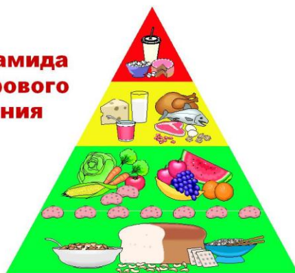
Пирамида здорового питания

Ведь, хорошее здоровье – залог Вашего успешного настоящего и будущего!!!