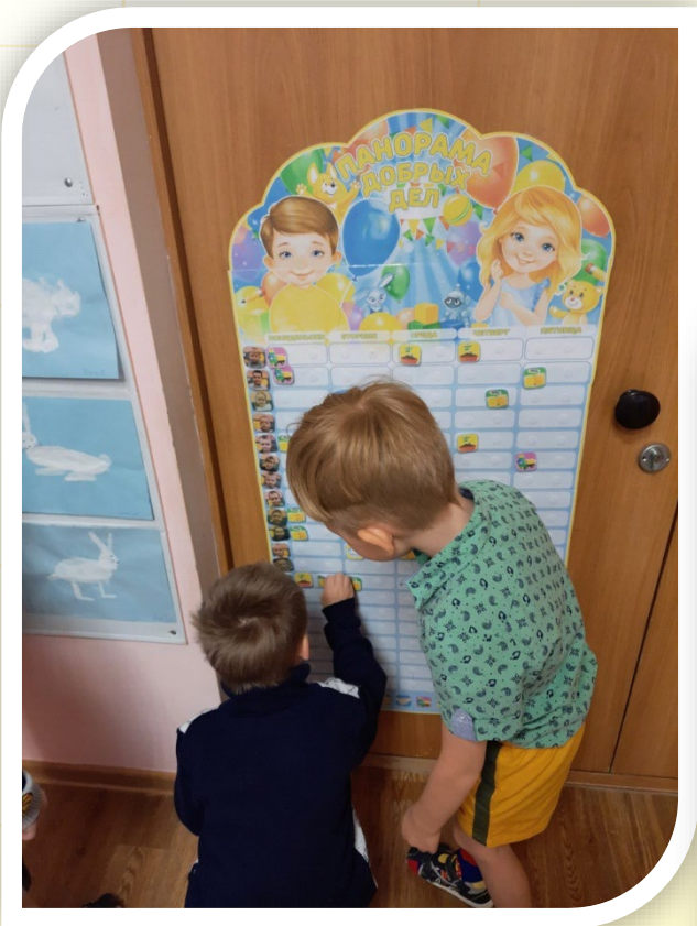
«Панорама добрых дел»