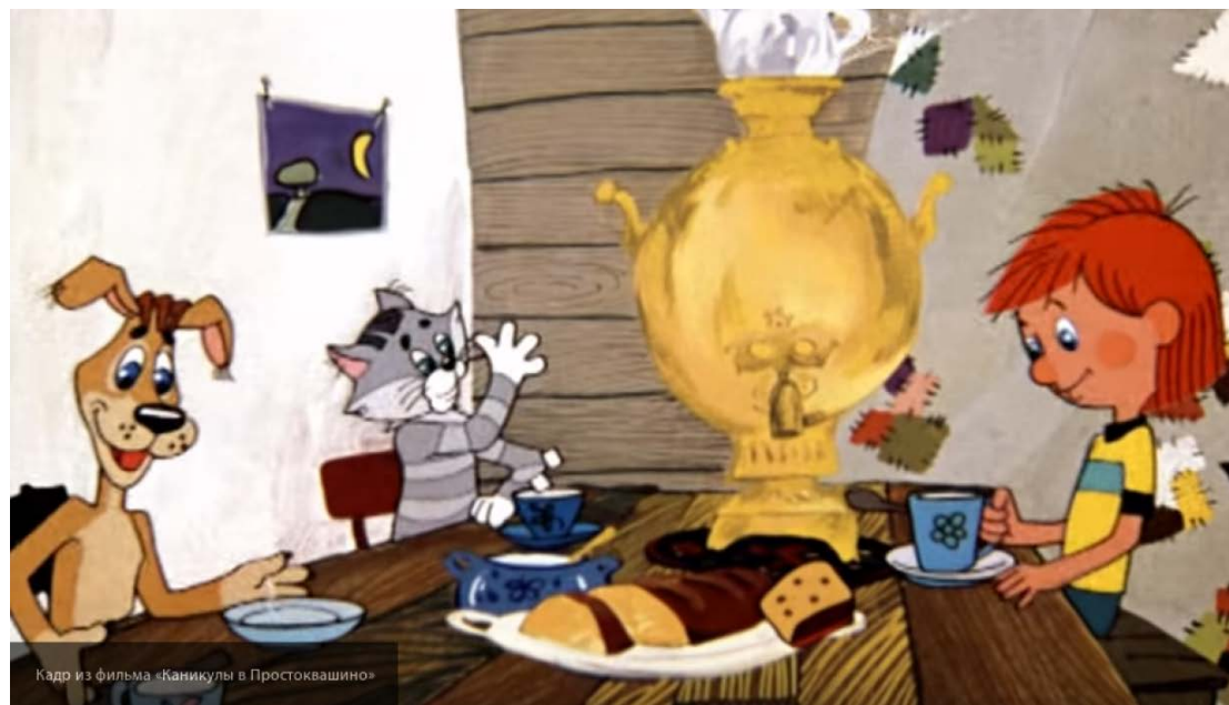
Кадр из фильма «Каникулы в Простоквашино»