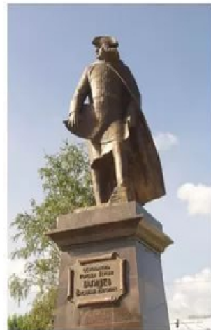
Василия Никитича Татищева