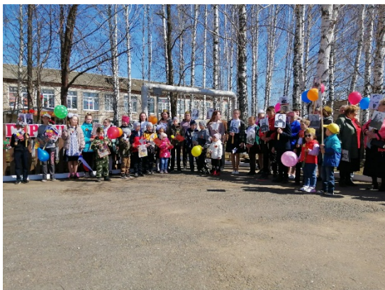
Праздничный митинг «Мы помним...»