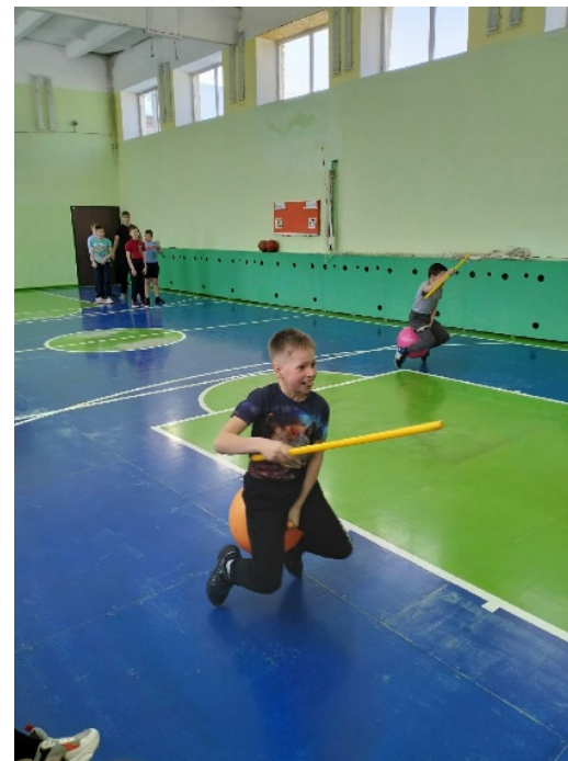
«Веселые старты, эстафеты, Дни здоровья»