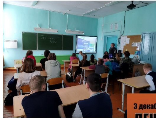
Акция «Блокадный хлеб»