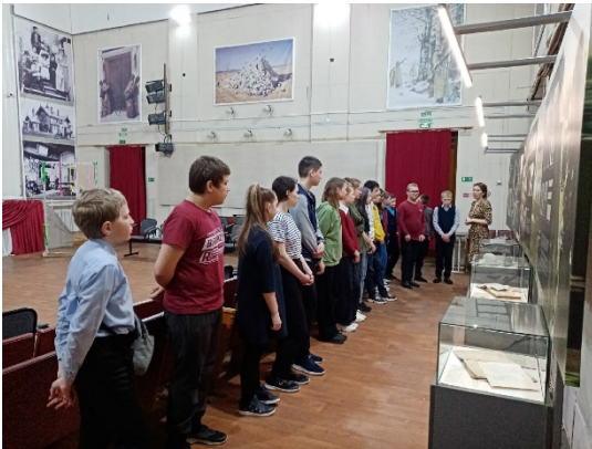
выставка г. Очер " Наш летчик из второй поющей"