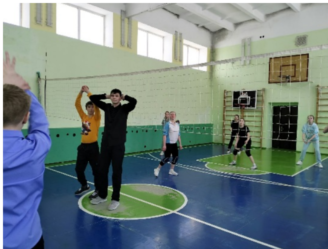
дружеские встречи по волейболу