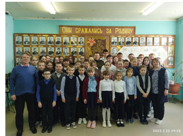
Встреча с выпускником школы, участником СВО