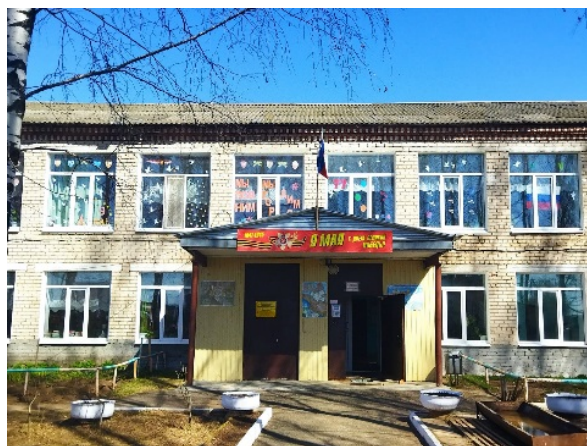
Всероссийская акция «Окна Победы»