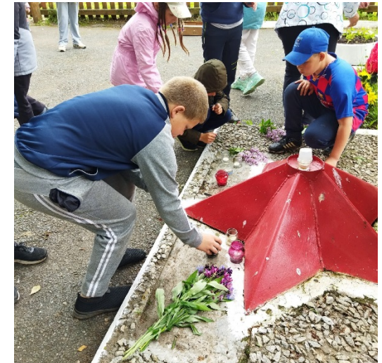
Акция «Свеча памяти»