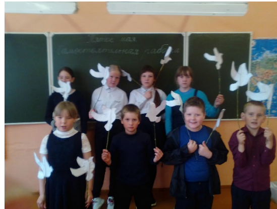
Акция «Голубь мира»