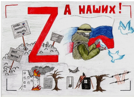
Муниципальный конкурс «Во славу Отечества!»