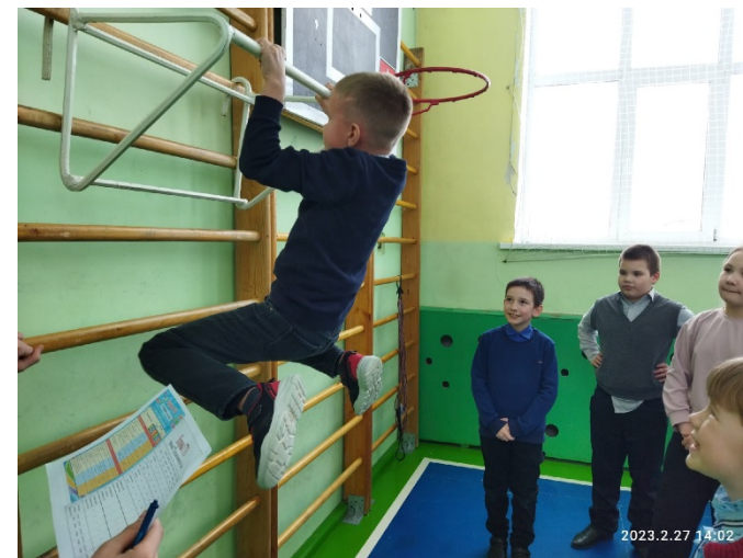
Сдача норм «ГТО»