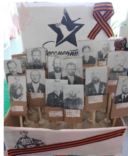
Всероссийская акция «Бессмертный полк»