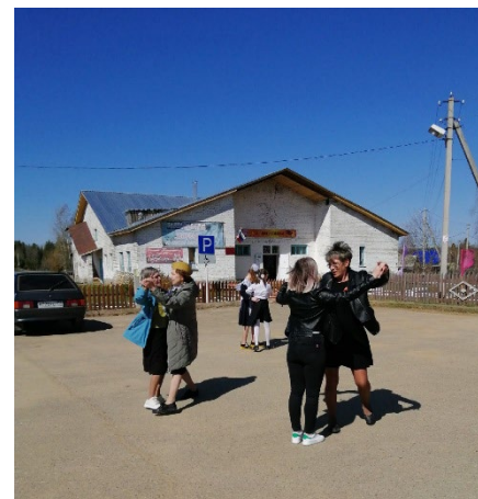
Всероссийская акция «Вальс Победы»