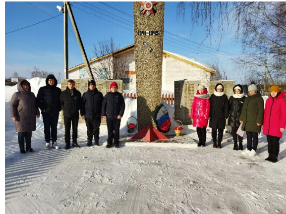
Возложение венков и цветов к памятнику воинам, погибшим в ВОВ