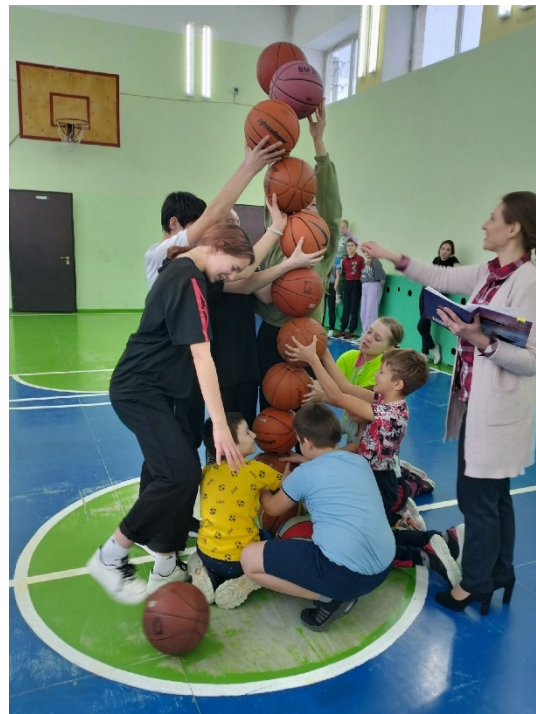
Военно-спортивная игра «Армейские будни»