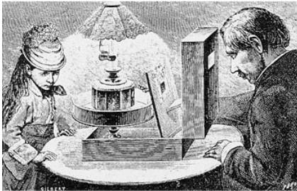
Усовершенствованный «оптический театр»